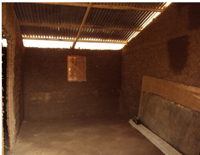
Abri en construction, aperçu du bancotage intérieur du séjour avec vue sur une fenêtre peinte posée