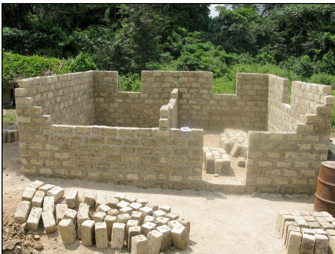
Construction en cours