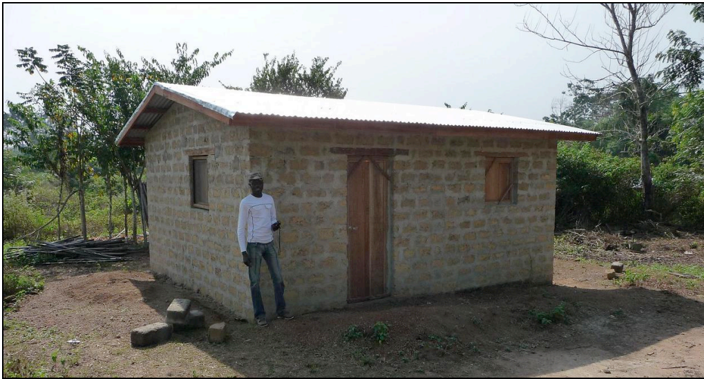
Abris CICR, 30 m2 – Géo brique et toiture en tôle avec planches de rive et charpente en bois rouge – deux pièces, deux portes et 4 fenêtres