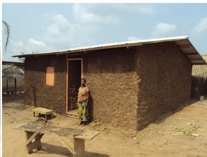
Aperçu d'ensemble d'un abri entièrement achevé avec vue des façades principale et latérale droite