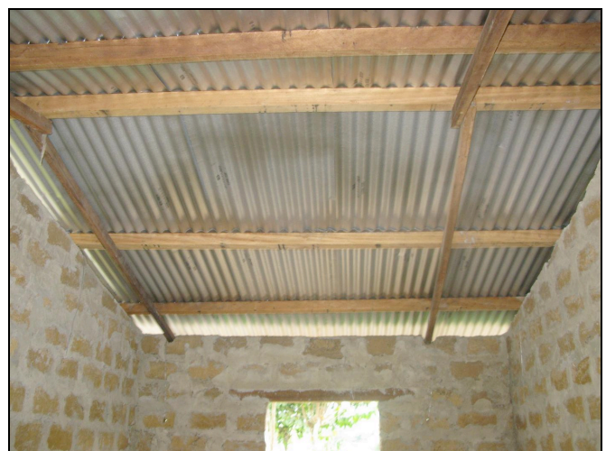
Abris CICR terminé