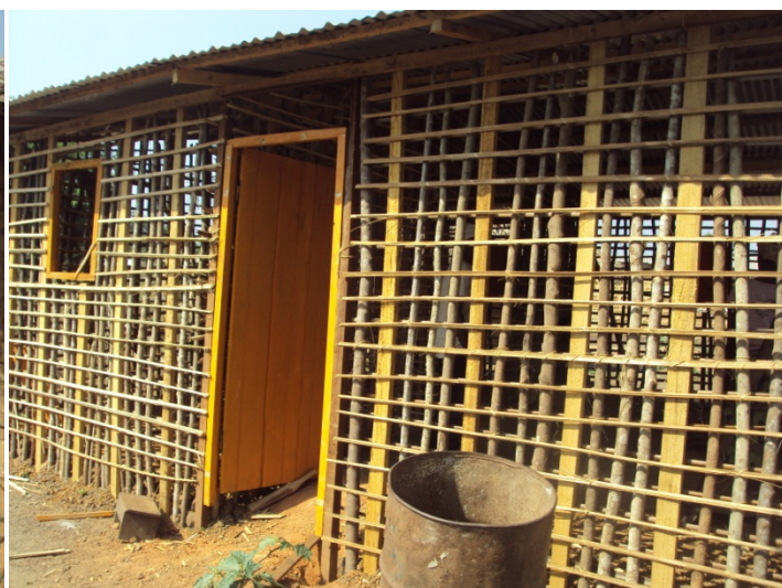
Abri en construction, vue de la façade avant avec une porte et une fenêtre peintes posées