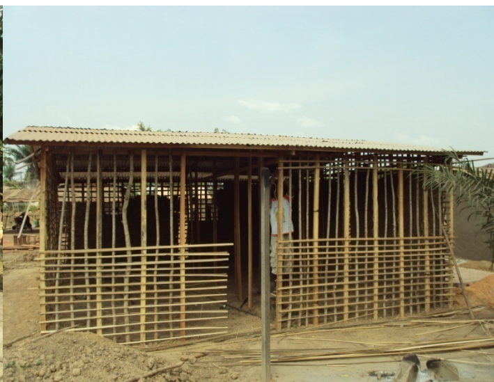
Abri en construction, treillage en bambous en cours d'exécution