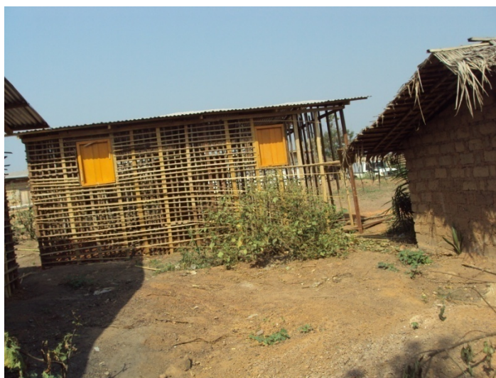
Abri en construction, vue de la façade arrière avec deux fenêtres peintes posées