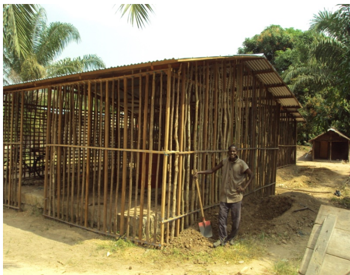
Abri en construction, perches, charpente et couverture posées