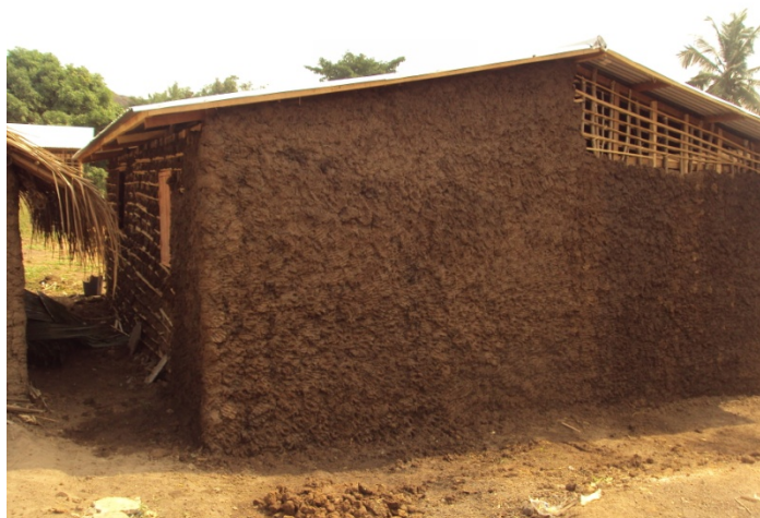
Abri en cours d'achèvement, aperçu du bancotage extérieur des façades latérale gauche et arrière