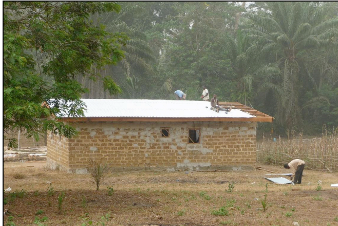
Diverses réhabilitations en cours