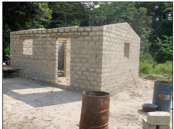
Construction en cours