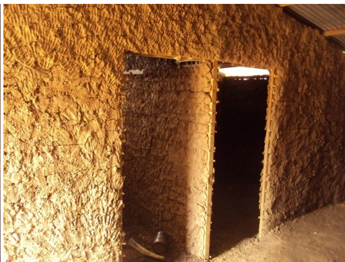
Abri en construction, aperçu du bancotage intérieur du séjour avec vue sur les deux ouvertures des chambres