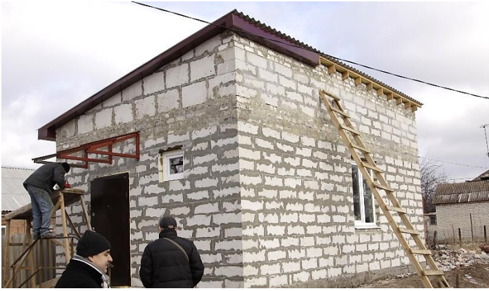
Проект Червоного Хреста Люксембургу, спрямований на відновлення повністю зруйнованих будинків в Слов'янському районі Семеновка, грудень 2015