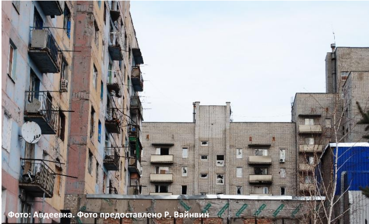
Фото: Авдиевка.