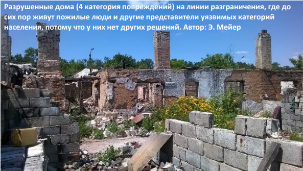
Разрушенные дома (4 категория повреждений) на линии разграничения, где до сих пор живут пожилые люди и другие представители уязвимых категорий населения, потому что у них нет других решений.