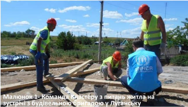
Малюнок 1- Команда Кластера з питань житла на зустрічі з будівельною бригадою у Луганську

Консультації з підготовки до зими. У червні Кластер з питань житла почав консультаційні наради для підготовки до зими 2017-2018. Партнери зустрілись у Слов'янську, Северодонецьку, Донецьку та Луганську щодо підготовки підходів до підконтрольних та невідконтрольних українській владі територій відповідно. На підконтрольних територіях партнери Кластера з питань житла поставлять в пріоритет забезпечення засобами опалення постраждалими в результаті конфлікту, а також будуть намагатись розробити з пріоритетом на відновлення та готовністю до зими отримувачами допомоги на підконтрольних уряду України територіях. Потреби невідконтрольних територій включають в себе опалення, основні елементи для підготовки до зими та теплову ізоляцію житла. Доступ є одним з обмежень для забезпечення підтримки найбільш постраждалими від конфлікту населенню.