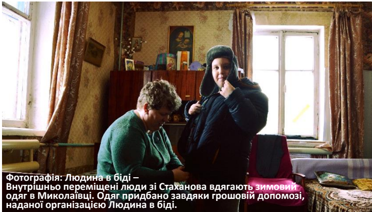
Фотографія: Людина в біді – Внутрішньо переміщені люди зі Стаханова вдягають зимовий одяг в Миколаївці. Одяг придбано завдяки грошовій допомозі, наданій організацією Людина в біді.