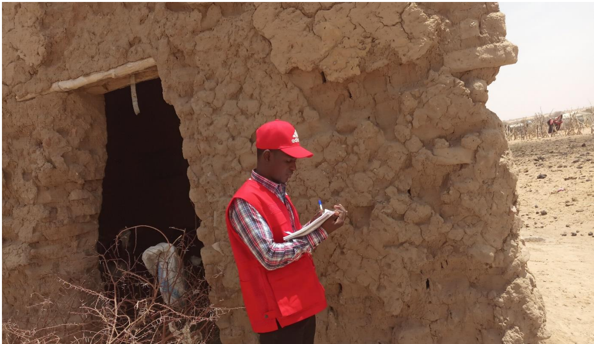
Figure 1: Evaluation d'une maison en banco à Koigouma