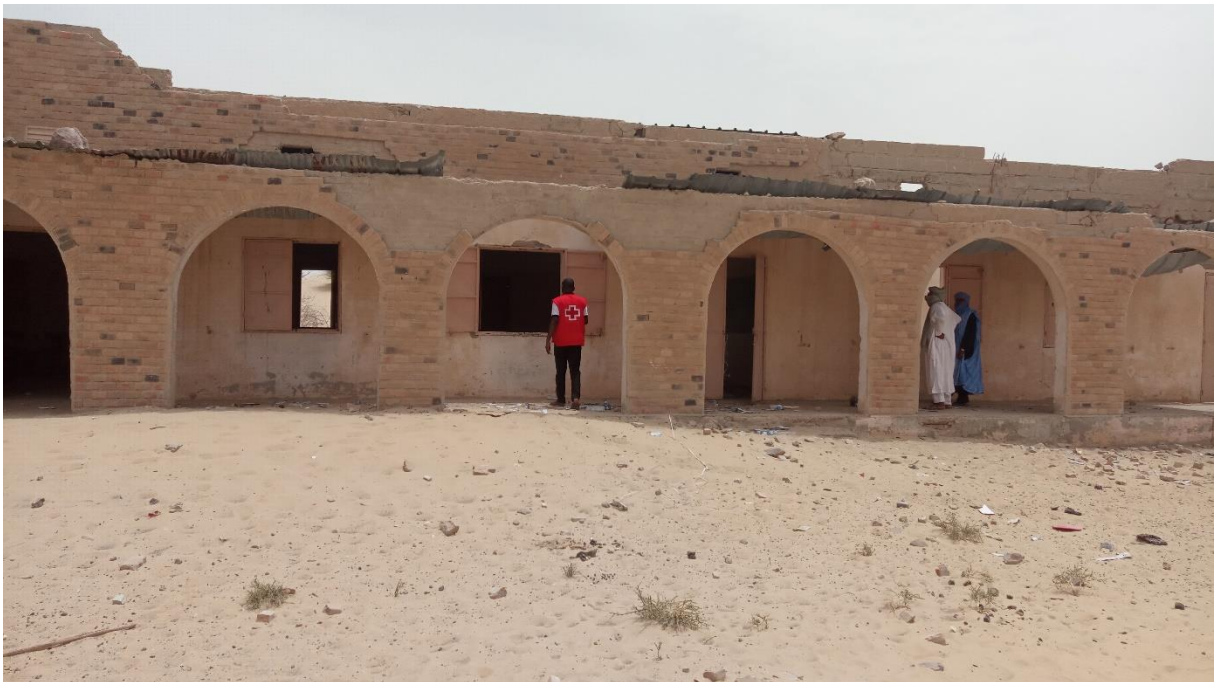
Figure 4: Infrastructure scolaire de Koigouma