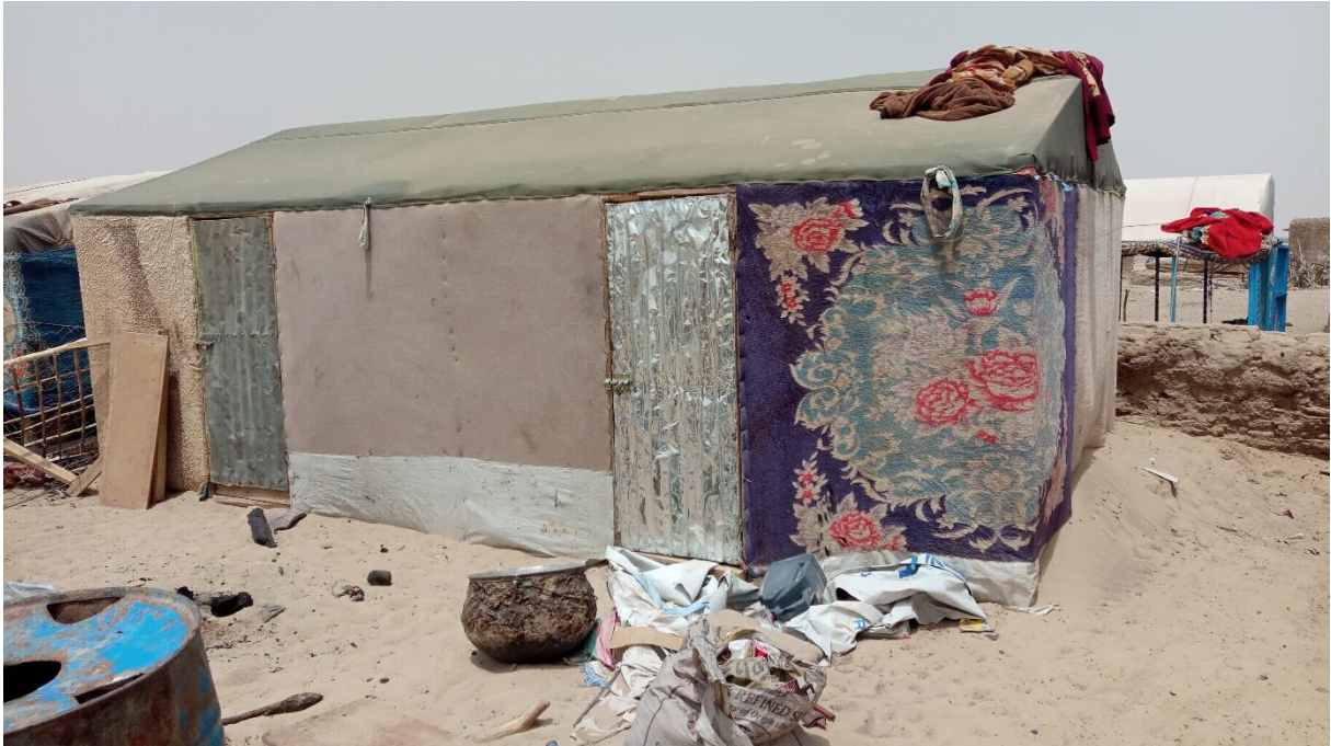
Figure 3: Tente moderne à Koigouma