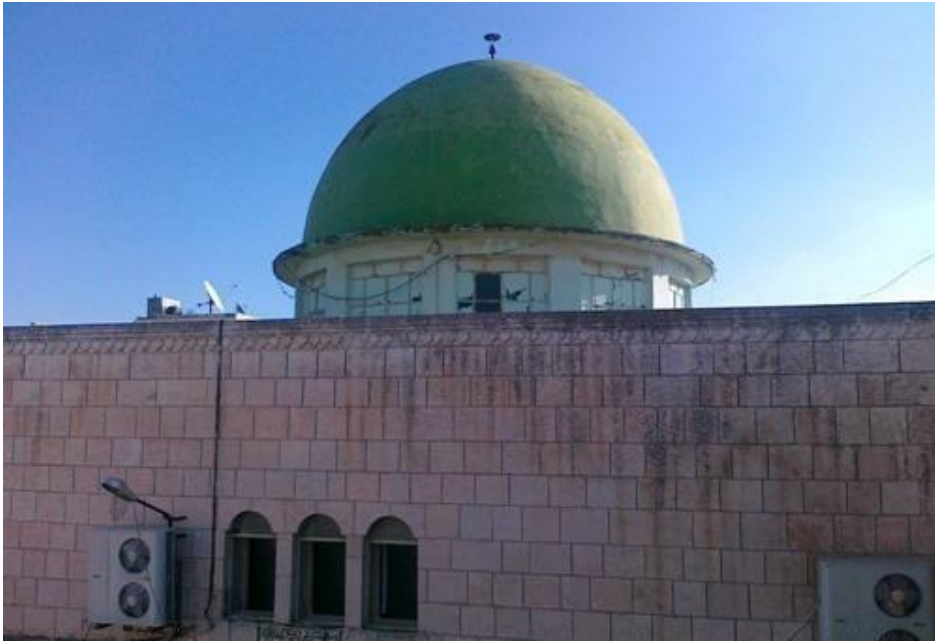
صور بناء ديني

الملاجئ الجماعية هي في الغالب مبانٍ مجتمعية تعمل كمأوى مؤقت للعديد من العائلات. داخل المأوى الجماعي، قد تنام العائلات في مساحة مفتوحة واسعة، في غرف فردية، أو في وحدات مقسمة ولكنها تشترك في نفس المرافق.