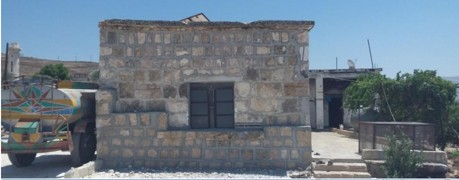
منزل مستقل غير متضرر